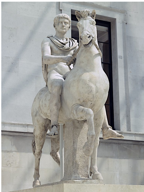
British Museum, Londres