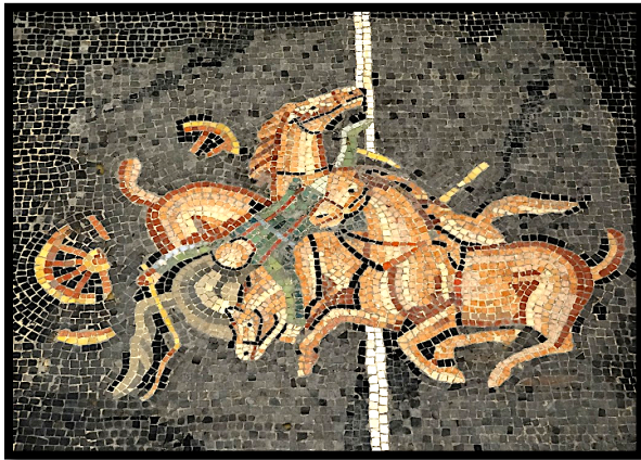
Mosaïque du cirque (détail) Musée gallo-romain, Lyon-Fourvière

(victime de la malédiction de Carthage ?)