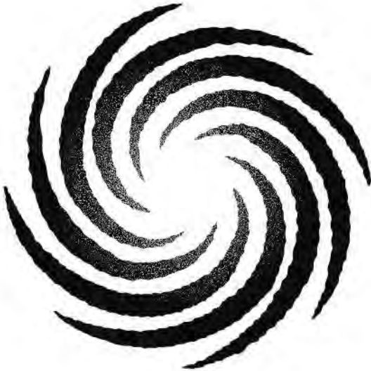
Le Chaos premier principe originel

Le terme nihil est la forme neutre du pronom nemo : celui-ci provient d'une contraction de la négation ne et du nom homo («homme, être humain»). On tire de nihil le «nihilisme» (pensée philosophique liée au rien).