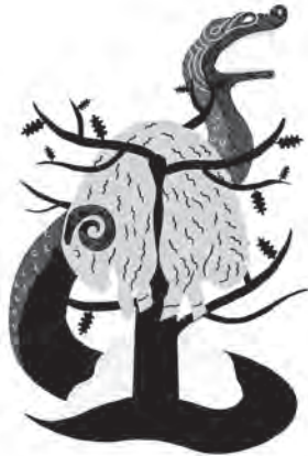
La Toison d'or.

25. Iason enim ei dixit : « Si mihi auxilium fers, polliceor me te uxorem ducturum esse. »