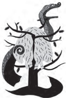
La Toison d'or.

Fils du roi d'Orchomène, en Grèce, Phrixos a échappé à un complot orchestré par Ino, sa marâtre, en s'enfuyant sur le dos d'un bélier volant à toison d'or. Parvenu en Colchide, Phrixos sacrifie le bélier et offre sa fabuleuse toison à Aïétès, roi de Colchide, un royaume correspondant approximativement à l'actuelle Géorgie, sur les bords de la mer Noire. Charmé par le trésor, le roi accepte d'accueillir Phrixos et il lui donne en mariage sa fille aînée, Chalciopé. En mémoire de cet épisode, le bélier est placé parmi les astres : il devient la constellation zodiacale du Bélier.