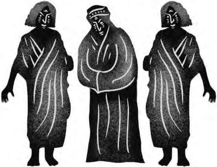
Les Grées, gardiennes des Hespérides

6. Un autre fils de la Nuit fut Charon qui vivait aux Enfers et traversait le fleuve Achéron : un portier effrayant surveille ces eaux et ces fleuves, Charon, à la saleté terrible, au menton recouvert d'une blancheur tout à fait négligée, dans l' Énéide de Virgile. Charon repousse les âmes qui n'ont pas leur obole.